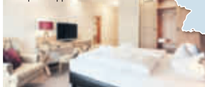
Beispiel Doppelzimmer Komfort