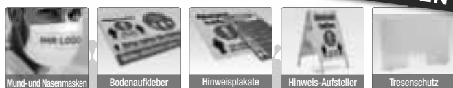
Mund- und Nasenmasken